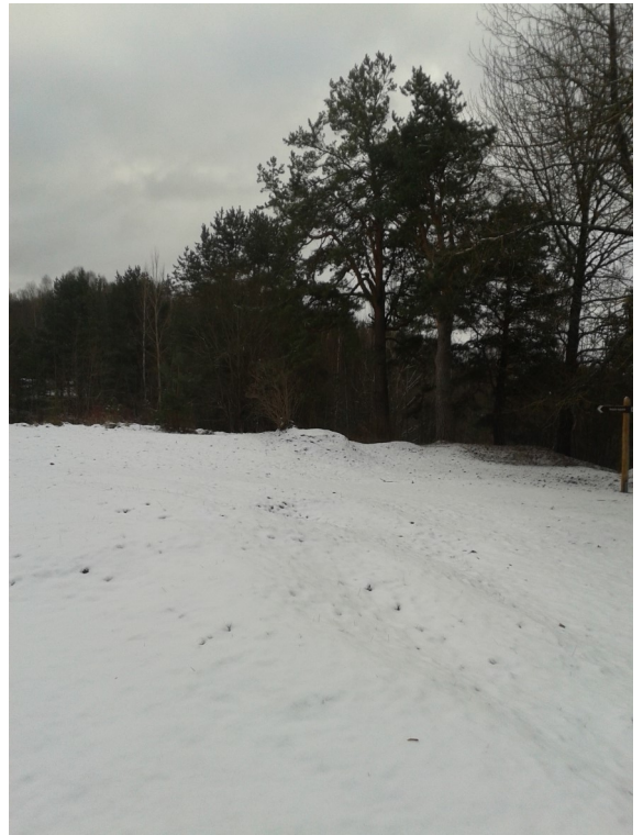
Piebraukšanas vieta plānotajai atpūtas vetai