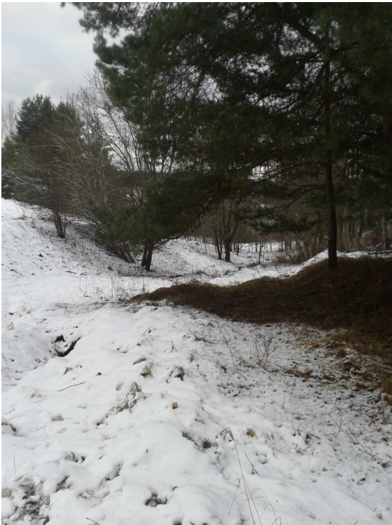
Taka uz pontonu laipu Daugavā

“Dinaburga –viduslaiku pils”, Naujenes pag., Daugavpils novadā