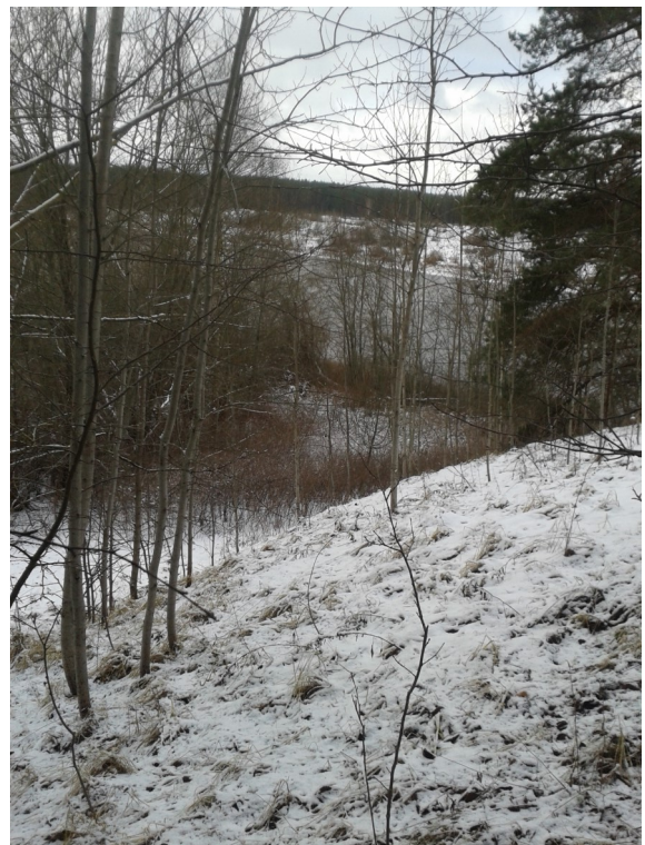
Skats no skatu terases vietas